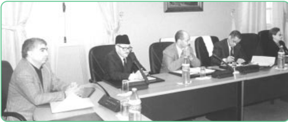
أحد اجتماعات لجنة الثقافة والإعلام والشباب والسياحة

لجنة الثقافة والإعلام والشباب والسياحة، درست برئاسة السيد محمد خاخا، رئيس