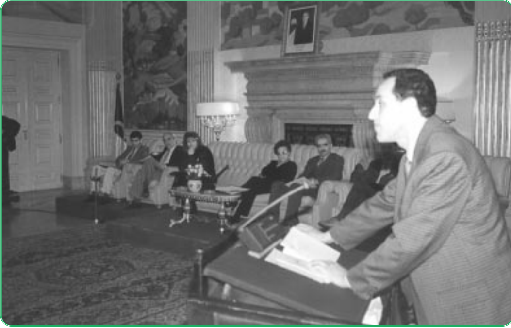
أمسية شعرية متميزة

نظمت لجنة التنشيط الثقافي والفكري التابعة لمجلس الأمة، ليلة 11 جانفي 1999، بمقر المجلس، أمسية شعرية، احتفالاً بمضي عام كامل على تأسيس مجلس الأمة، شارك فيها شعراء جزائريون وعرب مقيمون في الجزائر بحضور رئيس مجلس الأمة، السيد بشير بومعزة، وعدد من الوزراء وأعضاء البرلمان بغرفتيه.