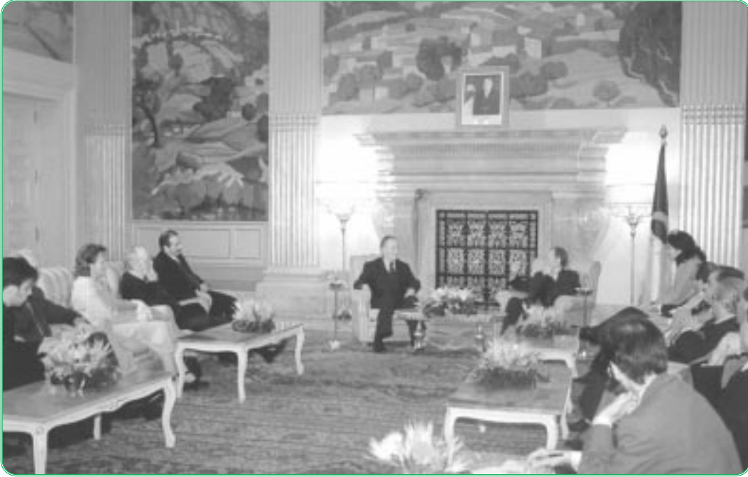
رئيس مجلس الأمة يستقبل الوفد البرلماني الايرلندي

المجلس، الوفد البرلماني الإيرلندي برئاسة السيد «اوستين ديزي» نائب رئيس لجنة الشؤون الخارجية.