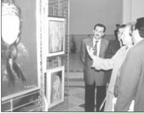
زيارة رئيس مجلس الأمة للمعرض الفني بمقر المجلس