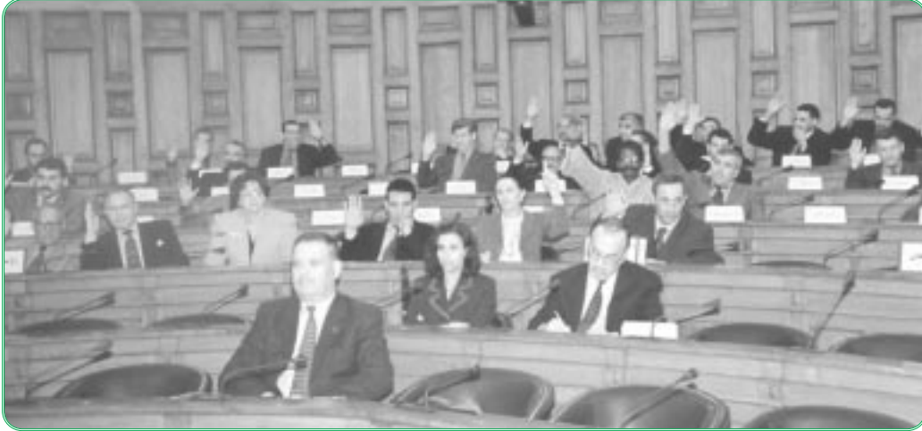
المصادقة على نص قانون التحكم في الطاقة

في 24 نوفمبر 1998: صادق مجلس الأمة برئاسة السيد بشير بومعزة، رئيس المجلس، وبحضور السيد محمد كشود الوزير المكلف بالعلاقات مع البرلمان، على