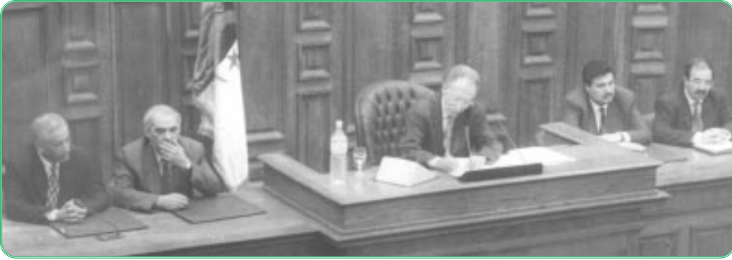
افتتاح الدورة الخريفية

افتتح السيد بشير بومعزة، رئيس مجلس الأمة، رسمياً الدورة العادية الثانية، يوم 3 أكتوبر 1999، بحضور رئيس الحكومة والوفد المرافق له، هذا بالإضافة إلى ممثلين عن مؤسسات الدولة.