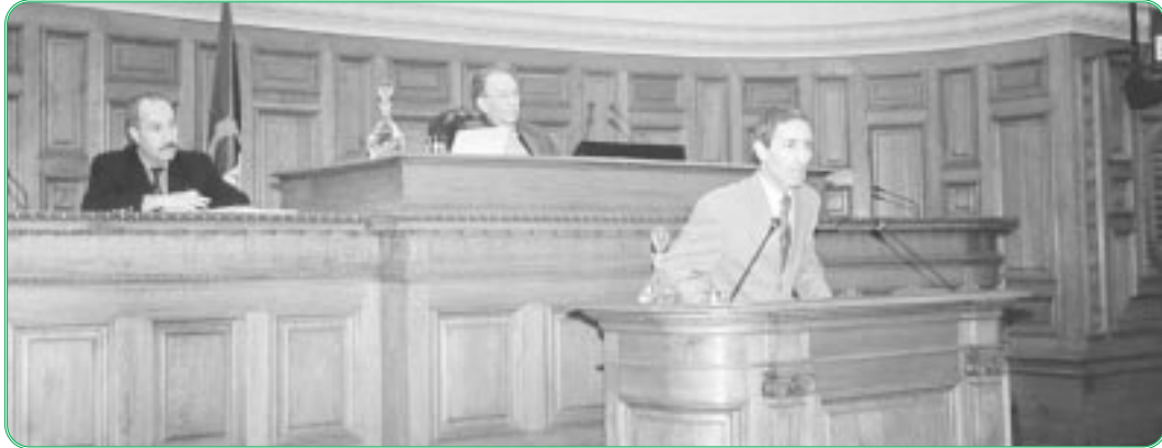
عرض وزير المالية السيد عبد الكريم حرشاوي، حول قانون المالية لسنة 1999

في 6 ديسمبر 1998: عرض وزير المالية، السيد عبد الكريم حرشاوي، أمام أعضاء مجلس الأمة، وبرئاسة السيد بشير بومعزة، رئيس المجلس، قانون المالية