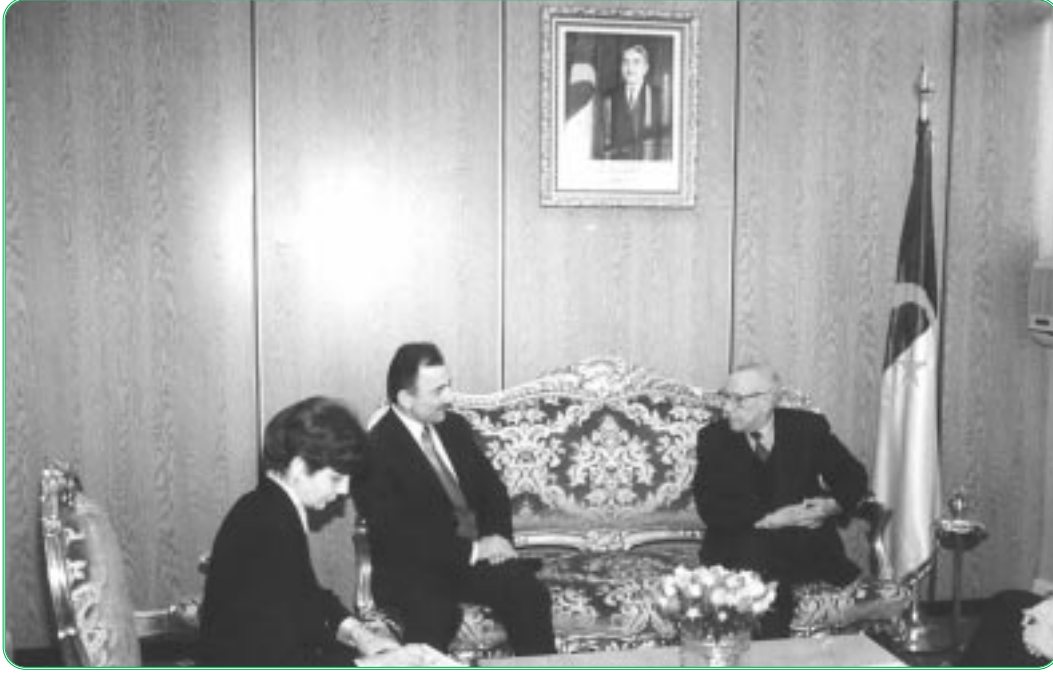
استقبال رئيس لجنة الشؤون الخارجية للجمعية الوطنية التركية الكبرى