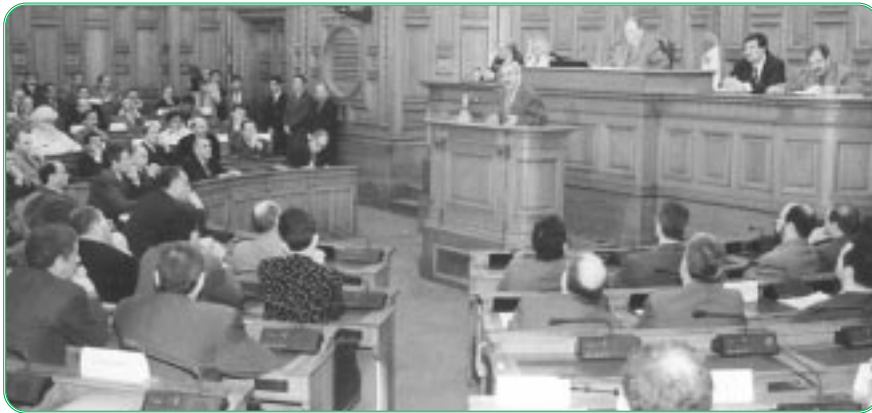
عرض رئيس الحكومة السيد اسماعيل حمداني لبرنامج حكومته

في 27 جانفي 1999: عرض رئيس الحكومة السيد اسماعيل حمداني برنامج حكومته في جلسة علنية صباحية ترأسها السيد بشير بومعزة وحضرها عدد من