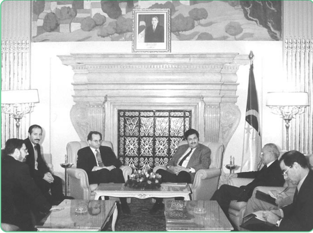
نائب رئيس مجلس الأمة يستقبل نائب رئيس الغرفة الأولى لبرلمان بولونيا