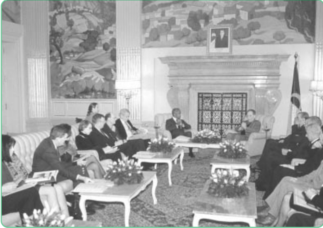
رئيس مجلس الأمة يستقبل كوفي عنان الأمين العام للأمم المتحدة

وبخصوص الحصار المفروض على العراق، ليبيا و كوبا، أشار السيد بشير بومعزة، رئيس مجلس الأمة، إلى الإنعكاسات اللاإنسانية لهذه الإجراءات على الشعوب.