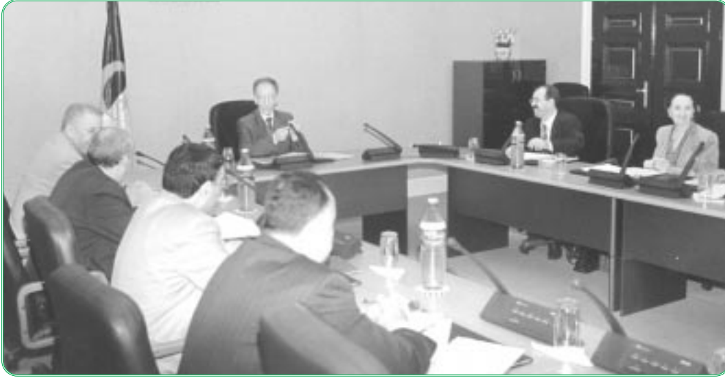
أحد اجتماعات هيئة التنسيق لمجلس الأمة