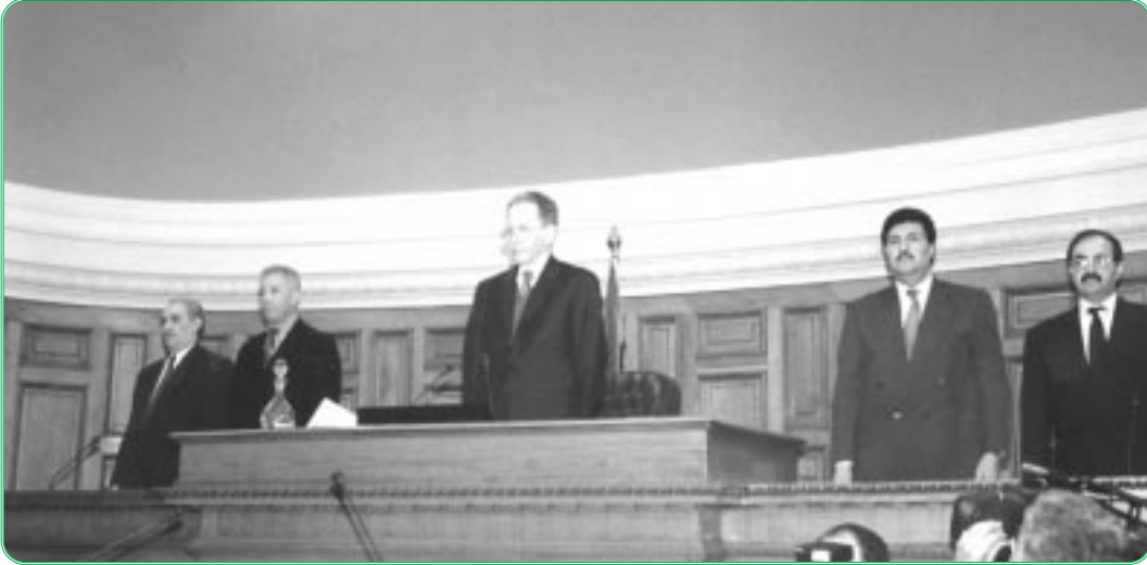
افتتاح أشغال الجلسات العامة

عقد مجلس الأمة خلال الدورة العادية الثانية الممتدة من 3 أكتوبر 1998 إلى 3 فبراير 1999، جلسات عامة درس خلالها مشاريع قوانين. وتمثلت الحصيلة الكاملة لأعمالها في مايلي :