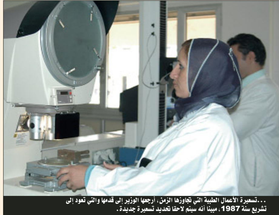
... تسعيرة الأعمال الطبية التي تجاوزها الزمن، أرجعها الوزير إلى قدمها والتي تعود إلى تشريع سنة 1987، مبينا أنه سيتم لاحقا تجديد تسعيرة جديدة.

وأوضح بخصوص تعويض الأدوية والسعر المرجعي، أن الجزائر تجاوزت الحد الأدنى للأدوية المعوضة المحددة من طرف المنظمة العالمية للصحة، كون الدولة الجزائرية تراعي البعد الاجتماعي إذ تعوض كل الأدوية الأساسية بنسبة 100%.