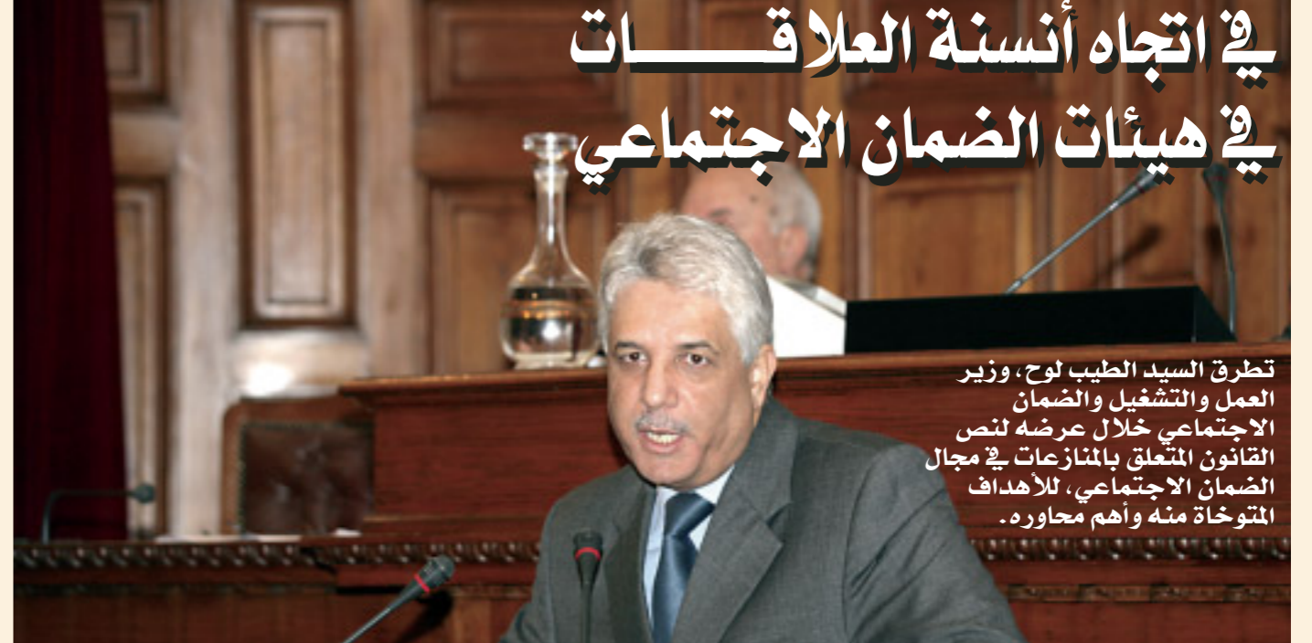
تطرق السيد الطيب لوح، وزير العمل والتشغيل والضمان الاجتماعي خلال عرضه لنص القانون المتعلق بالمنازعات في مجال الضمان الاجتماعي، للأهداف المتوخاة منه وأهم محاوره.

الجزائر، وأن تتوفر على آليات تحصيل ناجعة تعد جزءا أساسيا لمواجهة الإشكالية، فموارد الضمان الاجتماعي حاليا - يضيف الوزير - مبنية على اشتراكات العمال والمستخدمين، وهو الأمر الذي يؤكد أهمية ترقية التشغيل كعنصر آخر في مواجهة إشكالية التوازنات المالية لمنظومة الضمان الاجتماعي، وفي هذا الصدد فإن وزارة العمل والتشغيل والضمان الاجتماعي على وشك الانتهاء من سياسة التشغيل، وهذا بالتنسيق بين مختلف القطاعات التي لها دور في ترقية التشغيل.